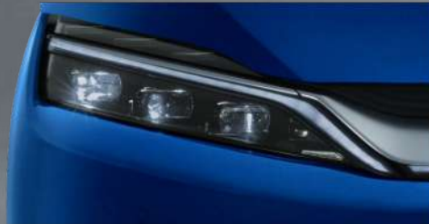
BYD Phares LED au design dragon