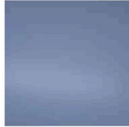
Performance Blue XG2