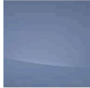
Performance Blue XG1