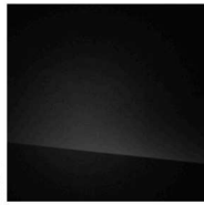
Alias Black A2B