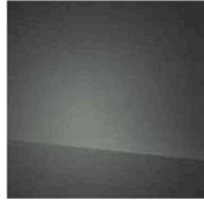
Electronic Grey PE2