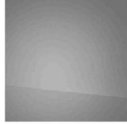
Cyber Grey CG1