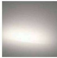
Glow/ Gold WT1