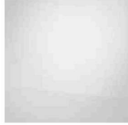
Alias White WAM