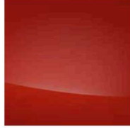
Sophistic Orange SOP